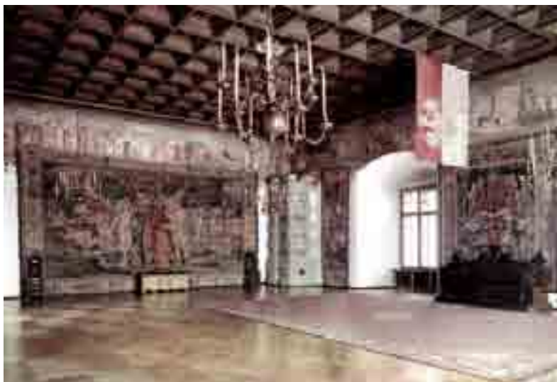
Zamek Królewski na Wawelu – sala Poselska