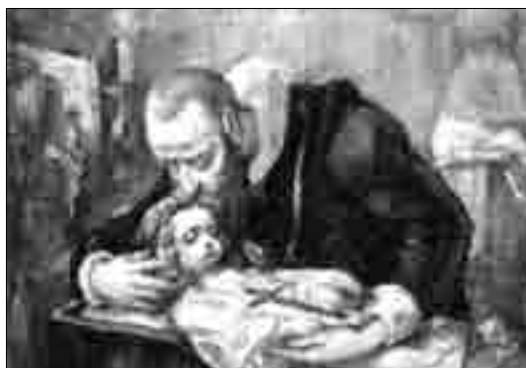
Jan Matejko, Jan Kochanowski nad zwłokami Urszulki