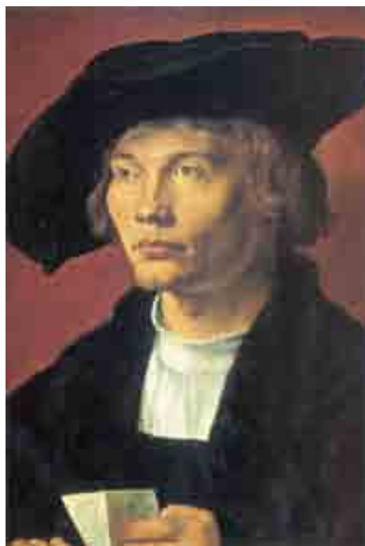
Dürer - Portret młodego mężczyzny